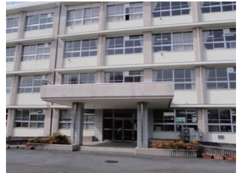
岐阜県立土岐商業高校 校舎

ただ、法的な部分や便利さゆえの危険性などについての理解や、今後更に環境が変わっていくと考えられるため、その変化への対応が求められると考えています。