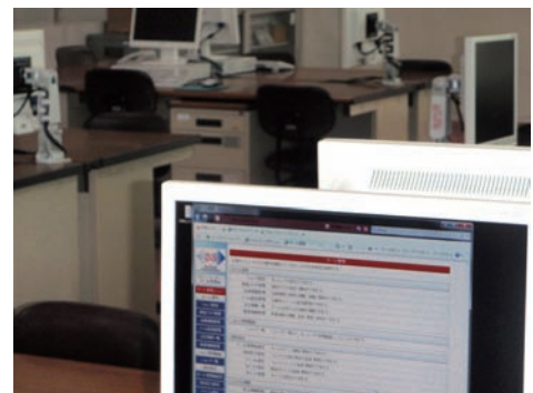
教室とスリーエスアカデミックパッケージの管理画面